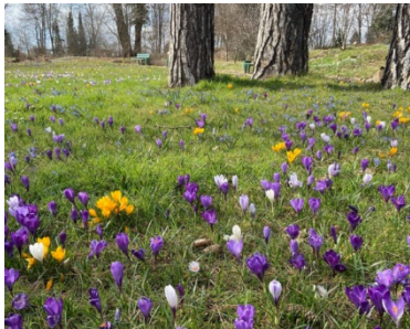
Ostern im Botanischen Garten