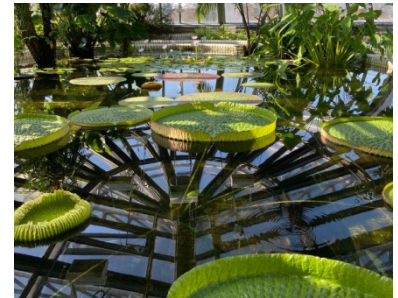
Rekordstart in die Seerosen- Saison