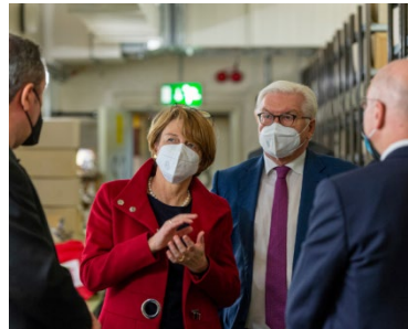
Besuch von Bundespräsident Frank-Walter Steinmeier und Elke Büdenbender