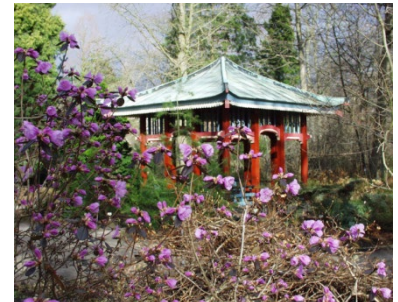
Öffnungszeiten & Corona-Infos im April