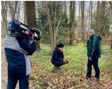
Auf Entdeckungstour mit der rbb Gartenzeit