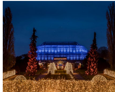
Vorfreude auf Weihnachten: Christmas Garden 2021